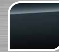
Dark Grey ME