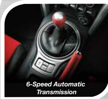
6-Speed Automatic Transmission