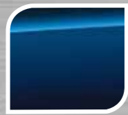
Galaxy Blue Silica

TRD hanya tersedia dengan warna Satin White Pearl, Crystal Black Silica, Orange ME & Lightning Red.