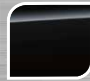
Crystal Black Silica