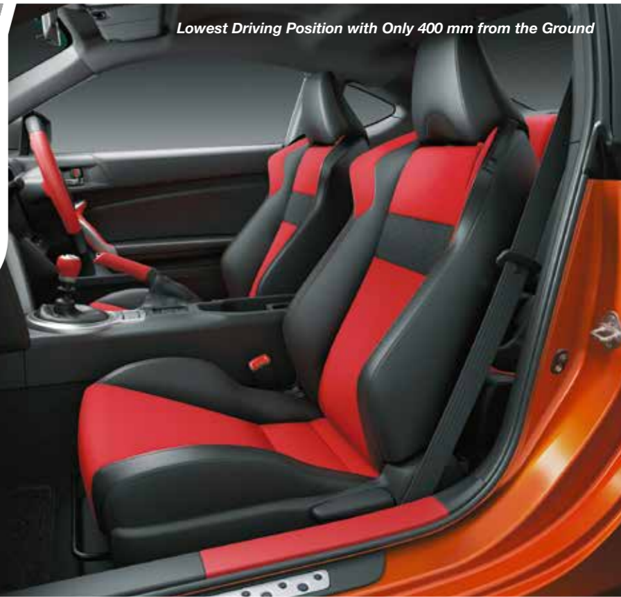
Lowest Driving Position with Only 400 mm from the Ground