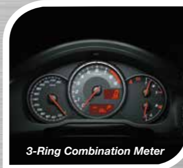
3-Ring Combination Meter