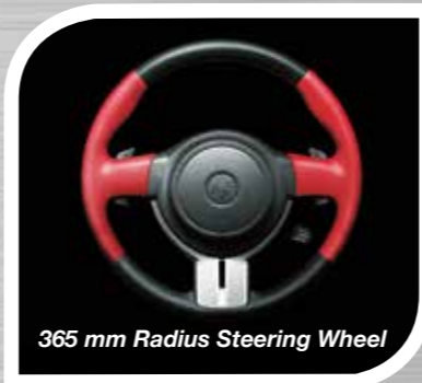
365 mm Radius Steering Wheel